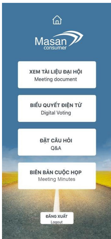
Trường hợp 1: Cổ đông tự tham dự họp

1.2.3. Tại trang chủ của Website, Cổ đông hoặc Người được ủy quyền dự họp chọn “BIỂU QUYẾT ĐIỆN TỬ” để tiến hành biểu quyết. Tại đây, Cổ đông hoặc Người được ủy quyền dự họp sẽ được xem lại số lượng cổ phiếu có quyền biểu quyết của mình. Đối với Người được ủy quyền dự họp, trang web sẽ hiện thông tin của cả Cổ đông ủy quyền (số lượng cổ phiếu còn lại của Cổ đông ủy quyền bằng 0 do đã ủy quyền cho người được ủy quyền dự họp). Trường hợp Người được ủy quyền dự họp cho nhiều Cổ đông khác nhau, Người được ủy quyền dự họp phải chọn lần lượt từng Cổ đông để biểu quyết.